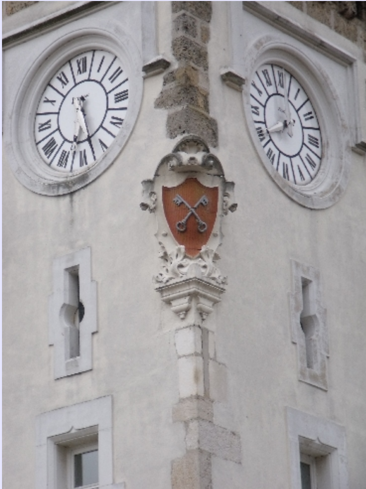
Tullins, Écusson sur la tour de l'ancien couvent des Minines